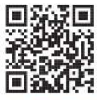
スタンプラリー詳細

※月さん賞・先輩賞の景品を受け取ったあとも、同じ台紙で次の賞を目指していただけます。目指せ宇崎ちゃん賞! ※プレゼントのお渡しは、三朝温泉ほっとプラ座 または、倉吉白壁土蔵群観光案内所にて。 ※プレゼントには数に限りがありますので、ご了承ください。